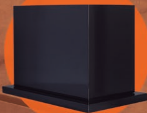
FARES / CAFÉ OSCURO