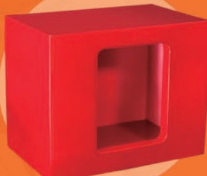
BETHEL / ROJA