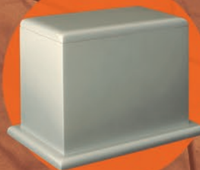
FARES / PLATA