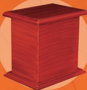
SAN JOSÉ / MADERA