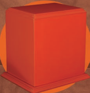
ADONAI / CAFÉ