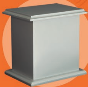
SAN JOSÉ / PLATA