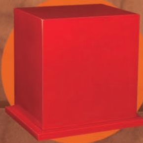
ADONAI / ROJA