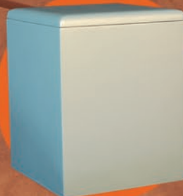
HANIEL / PLATA