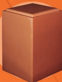
SHALOM / BRONCE