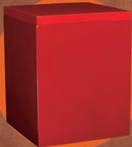
HANIEL / ROJA