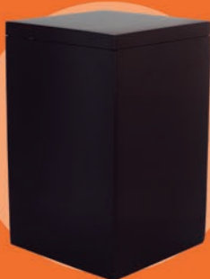
SHALOM / CAFÉ OSCURO