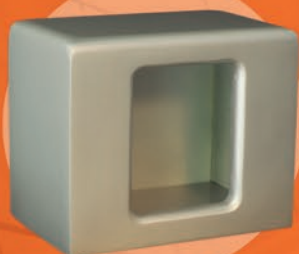
BETHEL / PLATA